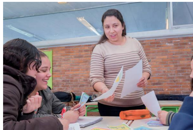
Estudios de posgrado para formadores rurales