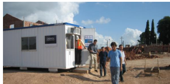
La experiencia en Fray Bentos