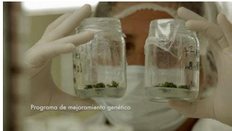
Operaciones en los viveros