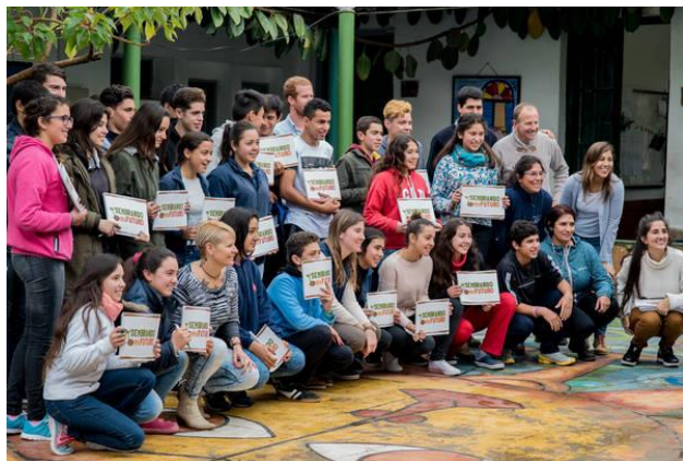
Promoción de la educación en las áreas rurales